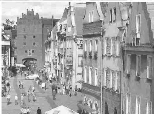
Blick auf das „Hohe Tor“ in Allenstein